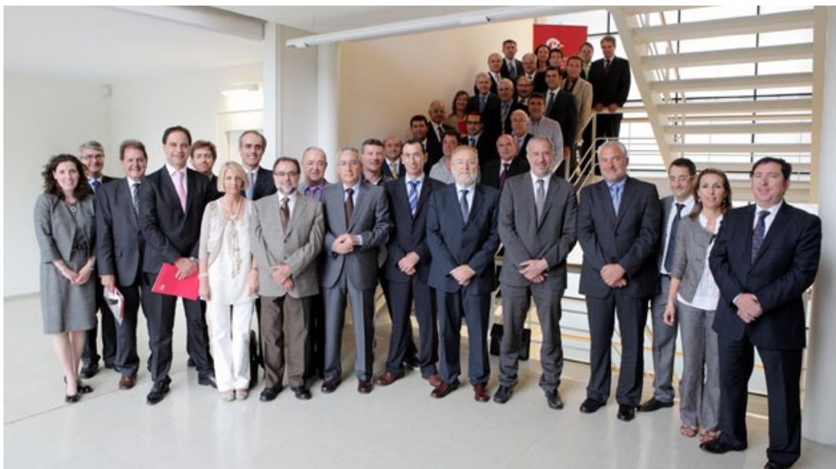
» Representants del Ple de la Cambra de Comerç i Indústria de Terrassa per al mandat 2010-2014