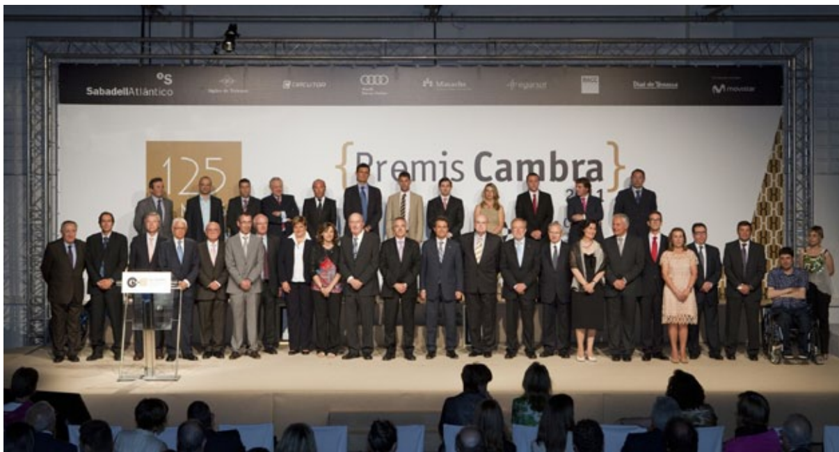
» Fotografia de grup dels guardonats en els Premis Cambra 2011, amb les autoritats i els patrocinadors

La Cambra va reunir més de 500 empresaris i representants del món polític, econòmic i institucional en l'edició 2011 dels Premis Cambra, commemorativa del 125è aniversari de l'entitat, per reconèixer públicament 12 empreses per la seva tasca en favor del desenvolupament econòmic, social i empresarial del territori. Així mateix, l'entitat també va reconèixer el lideratge empresarial d'un empresari de la seva demarcació.