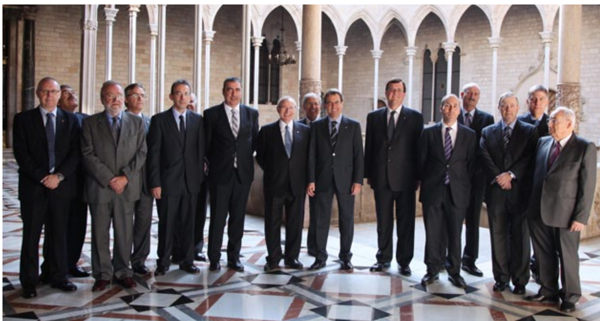
» Els presidents de les 13 cambres catalanes amb el president de la Generalitat de Catalunya i el conseller d'Empresa i Ocupació